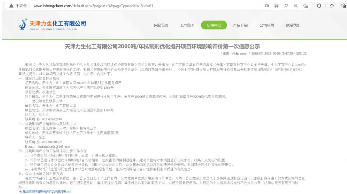
图1 网上公众参与第一次信息公示截图