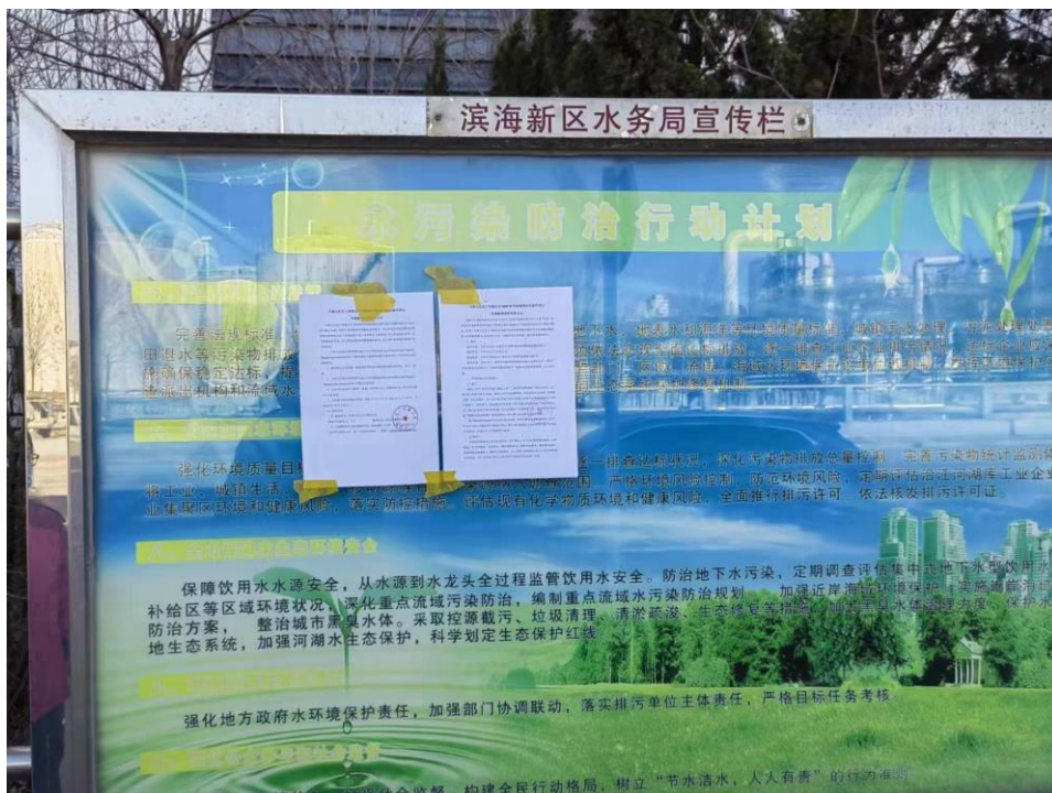
图 4 敏感目标及园区公示照片